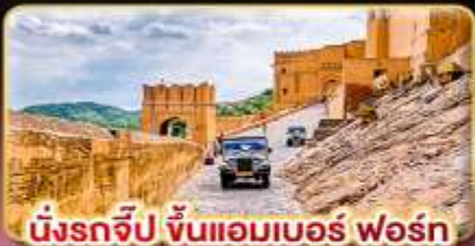
มังกรจีป ขึ้นแอมเบอร์ ฟอรั่ม