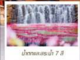
น้ำตกและสระน้ำ 7 สี

🗳️ โหลด 23 KG. x1 ทิ้งไป - กลับ ✓ ฟรีนียบตัว ✓ ไม่เข้าร้านรัฐบาล ✓ ทีวีรูปเล็ก ✓ รวมค่าเข้าชมสถานที่ตามโปรแกรม