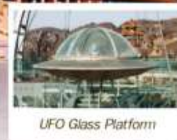
UFO Glass Platform