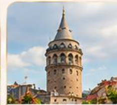
GALATA TOWER หอคอยกาลาตา