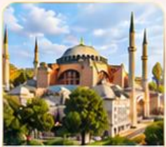
HAGIA SOPHIA โบสถ์เซนต์โซเฟีย