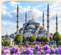
BLUE MOSQUE สุเหร่าสีน้ำเงิน