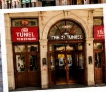
สถานีทูเนล (TUNEL STATION) สถานีรถไฟใต้ดินสายเก่าแก่และเป็นหนึ่งในระบบขนส่งที่เก่าแก่ที่สุดในโลก