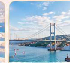
BOSPHORUS STRAIT ช่องแคบบอสฟอรัส