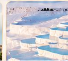
PAMUKKALE ปานุกคาล์