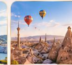
CAPPADOCIA คัปปาโดเกีย