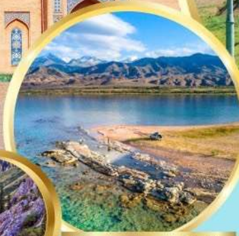
ล่องเรือทะเลสาบอิสซิค