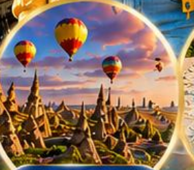
เมืองคัปปาโดเกีย Cappadocia