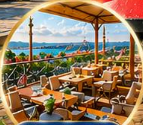
Seven Hills Cafe ชมวิว อิสตันบูล