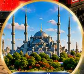
สุเหร่าสีน้ำเงิน Blue Mosque