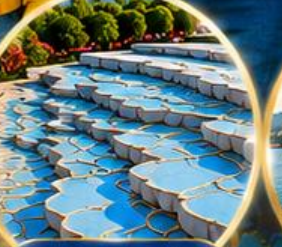
ปามุกคาล่ Pamukkale