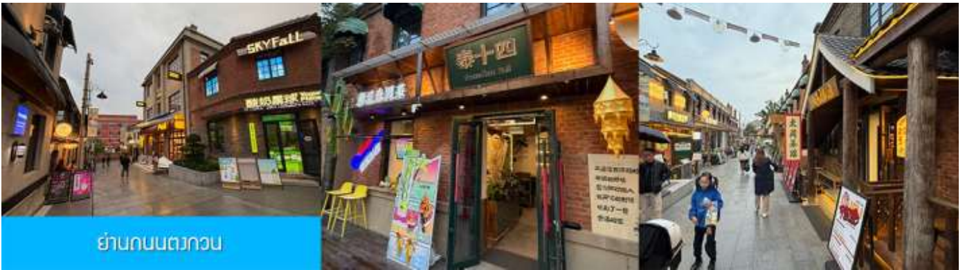
ย่านถนนตวงวน