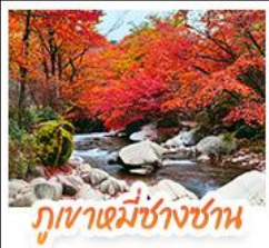
ภูเขาหมี่ซางซาน