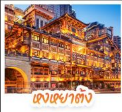
แสงเซาตัง

สัมผัสใบไม้แดงสุดงดงามที่ ภูเขาหมี่ซางซาน และ ภูเขากวงอู๋ซาน ชมวิวกลางคืนสุดอลังการที่ หงหยาดัง แลนด์มาร์กชื่อดังแห่งฉางชิ่ง สักการะพระโพธิสัตว์เจ้าแม่กวนอิม ณ วัดหลิงฉวน ขอพรเสริมสิริมงคล ช้อปปิ้งแลนด์มาร์กสุดฮิต แพนด้าปิ่นตึก IFS + POP MART ช้อปปิ้งจุใจที่ ไท่กุ่หลี่ ถนนคนเดินซุนชี่อู๋