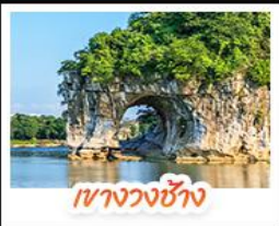
เขางวงช้าง