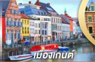
เมืองกันด์