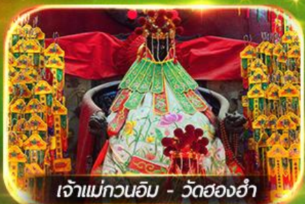
เจ้าแม่กวนอิม - วัดฮ่องกง