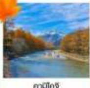
คามิโกจิ