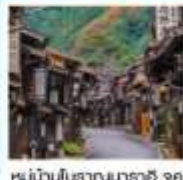
หมู่บ้านโบราณมาราชิ จูกุ