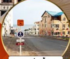
ถนนอ่าวจีป่า