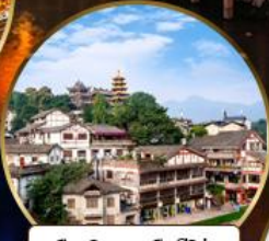
เมืองโบราณฉือจี้โข่ว