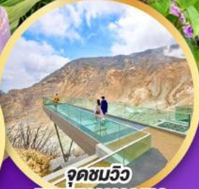
จุดชมวิว EARTH VALLEY

อิสระท่องเที่ยว ซ้อปั้งหนึ่งวันเต็มในโอซาก้า