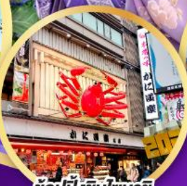
ซ้อปั้งชินโซบาช