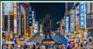
ถนนแดนแดนแดงซิงคู่