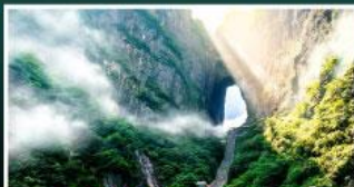
เขาประตูลสวรรค์