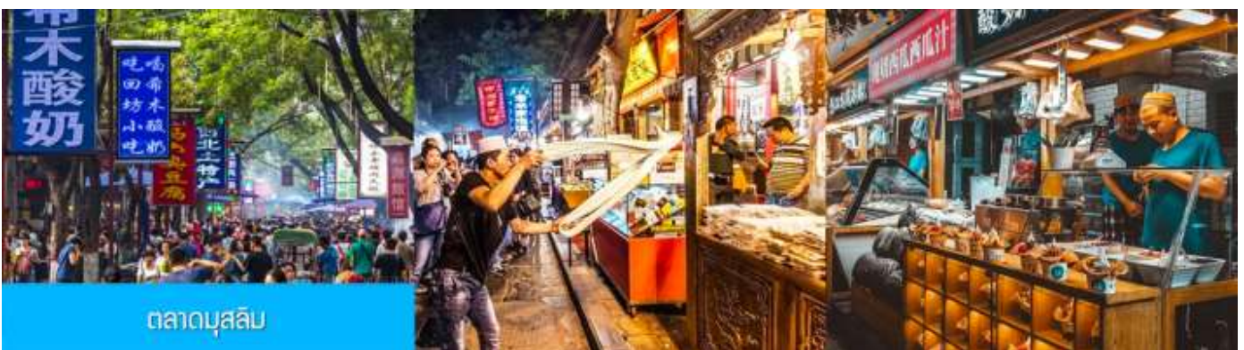
ตลาดบุนสลิบ