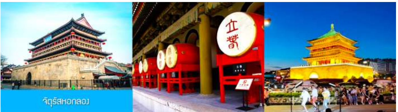
จัตุรัสหอกลอง