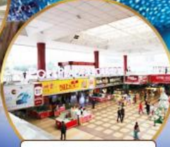
ตลาดกังเป๋ย