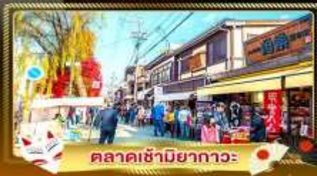
ตลาดซามิยามากาวะ