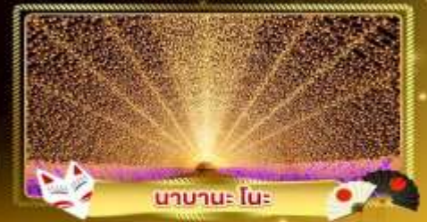
นานาเนะ โนะ