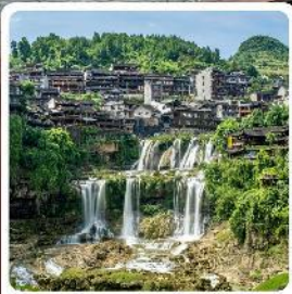
ฝูหลงเจิน