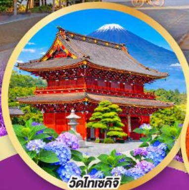
วัดโทเซคิจิ