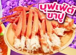
บุฟเฟ่ต์ ซาซึ