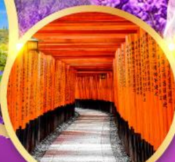
ศาลเจ้าฟุชิมิอินาริ