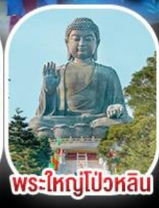
พระใหญ่โป่วหลิน