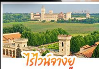
ไรไวน์ฟางยู