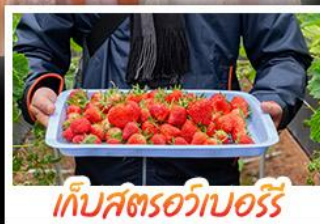
เก็บสตรอว์เบอร์รี่