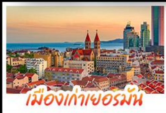
เมืองเก่าเยอรมัน

เมืองเก่าชิงเต่า - สลับกับเมืองโบราณหมิงสุ่ย เมืองเก่าเยอรมัน - ไรไวน์ฟางยู - สวนสตรอว์เบอร์รี่