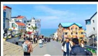
ถนนคอปเพิลิงหมายเลข 8

สัมผัสความยิ่งใหญ่ของ 4 เมืองสำคัญ ชิงเต่า - เยียนโก - เฟิงไห่ - เว่ยไห่ ปาต้ากวน - โบสถ์คาทอลิก - ตึกเก่าริมหา