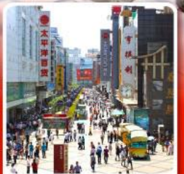
ช้อปปิ้งถนนคนเดินซุนซีลู่