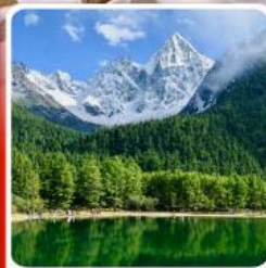
อุทยานปืฝิงโก