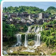
ผู้หลงใหล