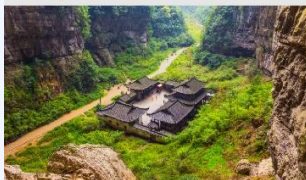
อุทยานหลุมฟ้าสะพานสวรรค์