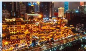
หงหยาดัง(ตอนกลางคืน)

*ทางบริษัทฯ ขอสงวนสิทธิ์ในการสลับโปรแกรมทัวร์ตามความเหมาะสมขึ้นอยู่กับสถานการณ์หน้างาน โดยคำนึงถึงผลประโยชน์ของลูกค้าเป็นสำคัญ