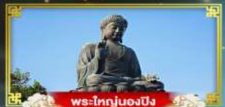
พระใหญ่ของปิง