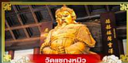
วัดเข่งทมิฬ