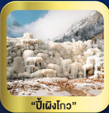
“ปี้ฝิงโกว”

นั่งกระเช้าชมวิว ภูเขาหิมะต้ากู่กลาเซียร์ • ชมความสวยงาม ณ อุทยานปี้ฝิงโกว ห้องสมุดจงชู่กั๋ว • ศูนย์หมีแพนด้า • ตงเจียงจี้จี้ • ซอยกว้างชวยเคบ