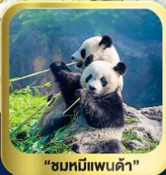
“ชมหมีแพนด้า”