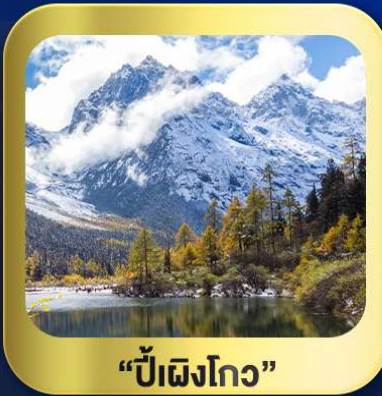
“ปี้ฝิงโกว”