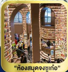
“ห้องสมุดจงชู่กั๋ว”