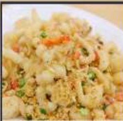
หมึกทอดกระเทียม