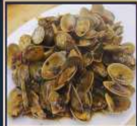
ผัดหอยลาย