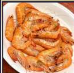
กุ้งหวานลวก