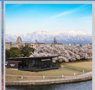
“TOYAMA KANSUI PARK”